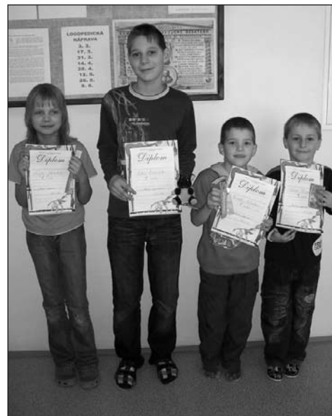
Vítězové „Školní superstar“