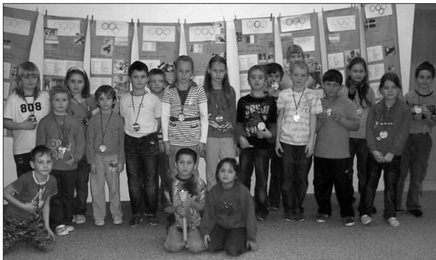
Žáci, kteří získali ocenění v projektu „Školní olympiáda“