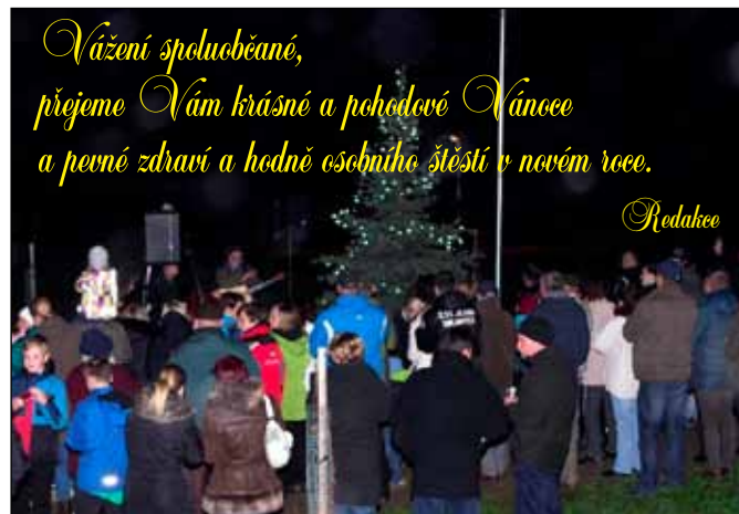
Rozsvěcení vánočního stromu u KD

Naopak kritizována byla především nevyhovující veřejná doprava, nedostatek pracovních příležitostí a také nízký zájem lidí o obec, o komunitní život v obci. Dotazovaní se také vyjádřili svoje názory na to, kam směřovat obecní fi-